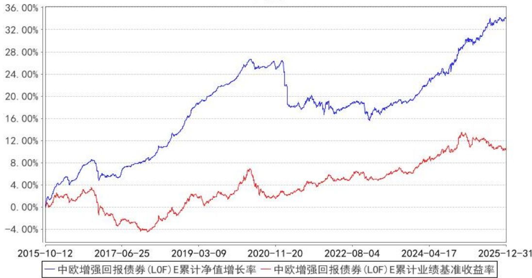
中欧增强回报债券（LOF）E 累计净值增长率与同期业绩比较基准收益率的历史走势对比图

注：本基金于 2015 年 10 月 8 日新增 E 份额，图示日期为 2015 年 10 月 12 日至 2025 年 12 月 31 日。