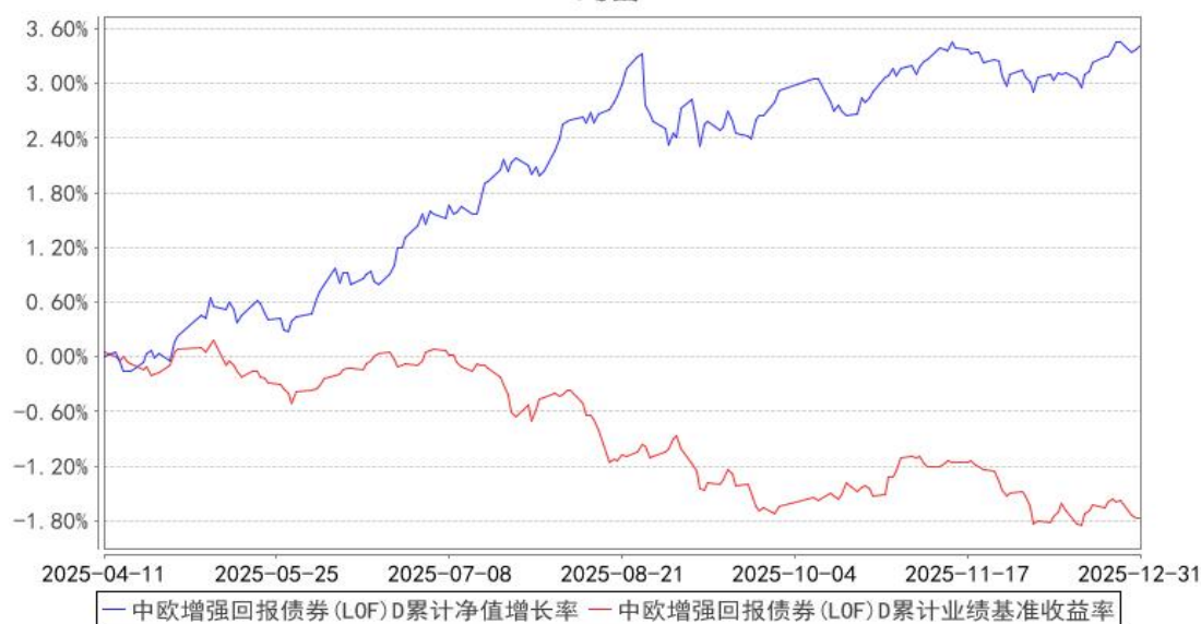
中欧增强回报债券（LOF）D 累计净值增长率与同期业绩比较基准收益率的历史走势对比图

注：本基金于 2025 年 3 月 26 日新增 D 类份额，图示日期为 2025 年 4 月 11 日至 2025 年 12 月 31 日。