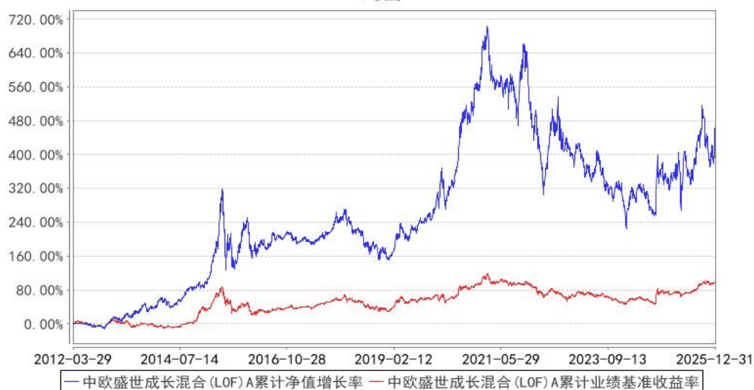
中欧盛世成长混合(LOF) A 累计净值增长率与同期业绩比较基准收益率的历史走势对比图