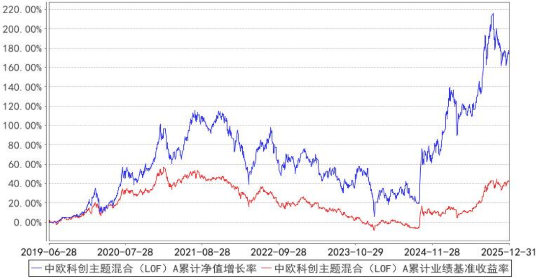
中欧科创主题混合（LOF）A 累计净值增长率与同期业绩比较基准收益率的历史走势对比图