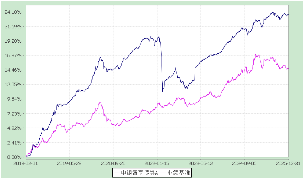
中银智享债券型证券投资基金 累计净值增长率与业绩比较基准收益率的历史走势对比图 (2018 年 2 月 1 日至 2025 年 12 月 31 日)