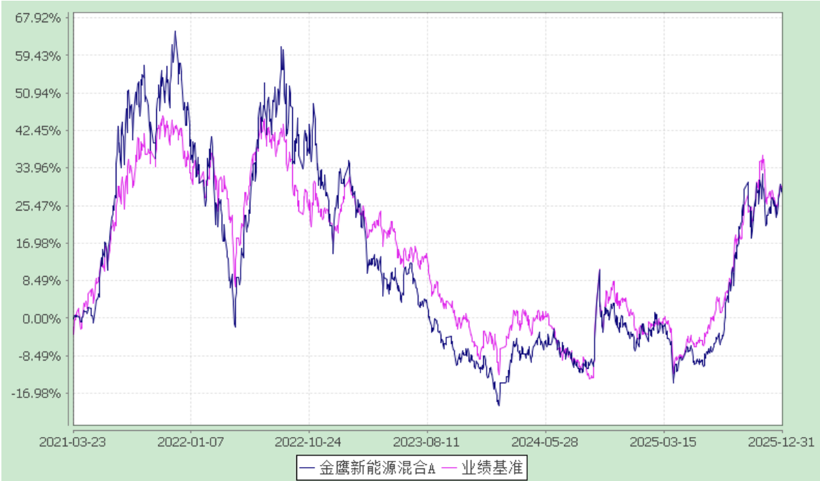
金鹰新能源混合型证券投资基金 累计净值增长率与业绩比较基准收益率的历史走势对比图 (2021 年 3 月 23 日至 2025 年 12 月 31 日)