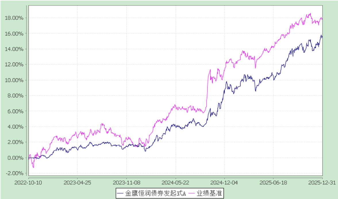
金鹰恒润债券型发起式证券投资基金 累计净值增长率与业绩比较基准收益率的历史走势对比图 (2022 年 10 月 10 日至 2025 年 12 月 31 日)