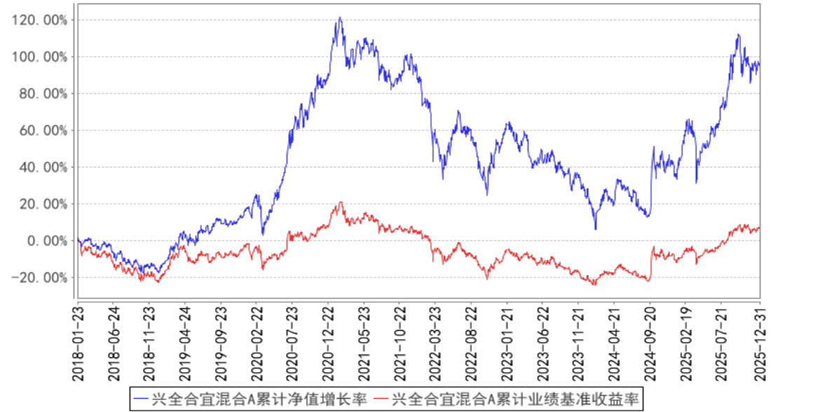
兴全合宜混合A累计净值增长率与同期业绩比较基准收益率的历史走势对比图