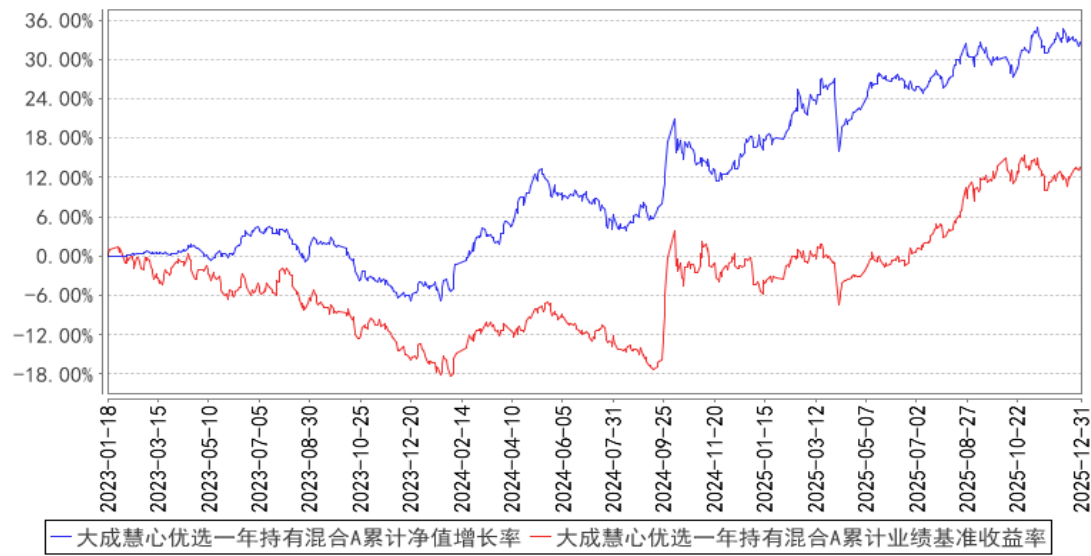
大成慧心优选一年持有混合A累计净值增长率与同期业绩比较基准收益率的历史走势对比图