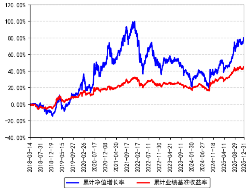
南方希元可转债债券A累计净值增长率与同期业绩比较基准收益率的历史走势对比图