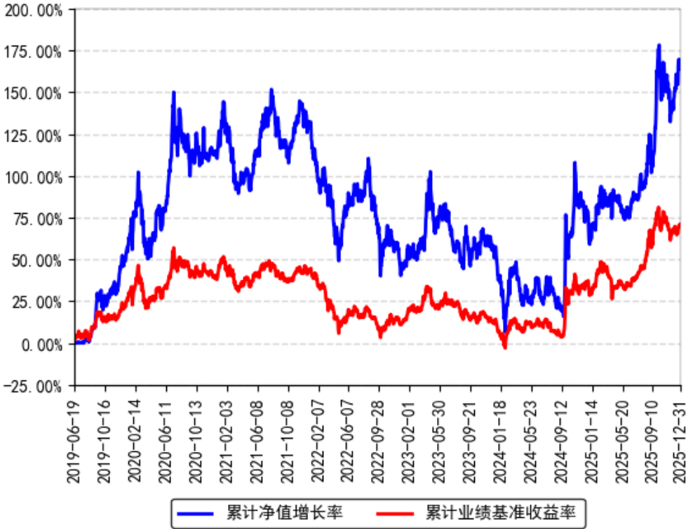
南方信息创新混合A累计净值增长率与同期业绩比较基准收益率的历史走势对比图