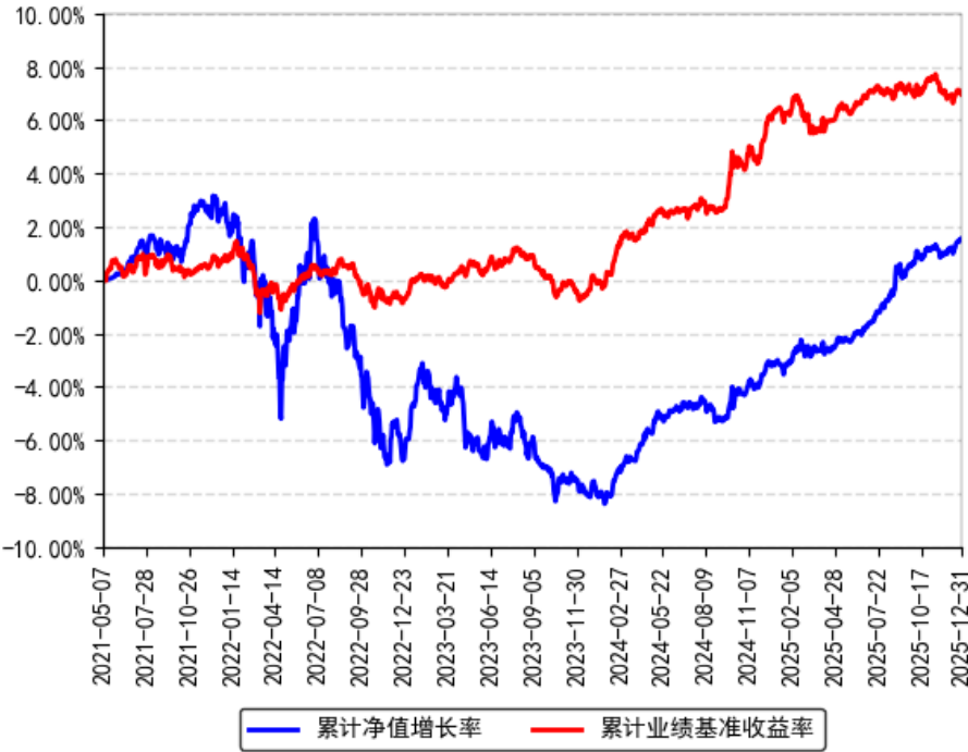
南方晖元6个月持有期债券A累计净值增长率与同期业绩比较基准收益率的历史走势对比图