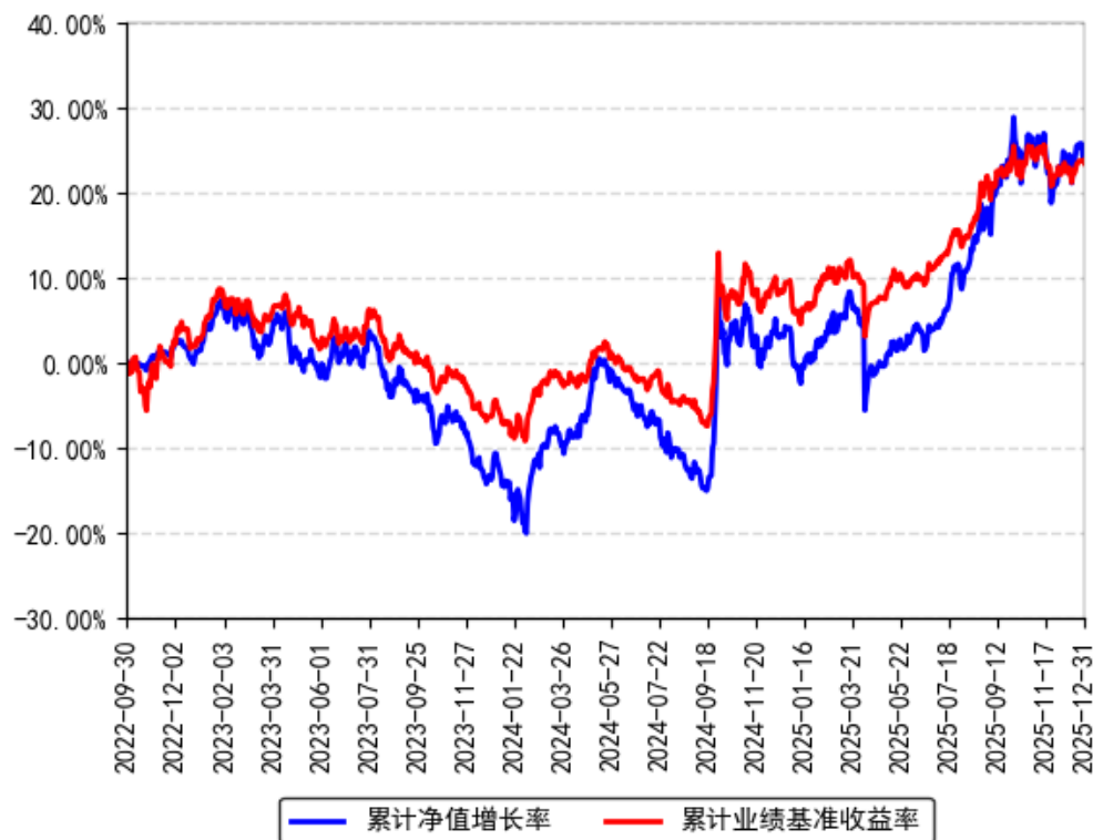
南方均衡成长混合A累计净值增长率与同期业绩比较基准收益率的历史走势对比图