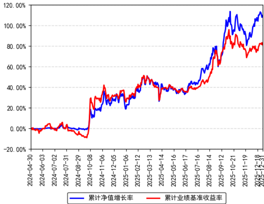
南方半导体产业股票发起A累计净值增长率与同期业绩比较基准收益率的历史走势对比图