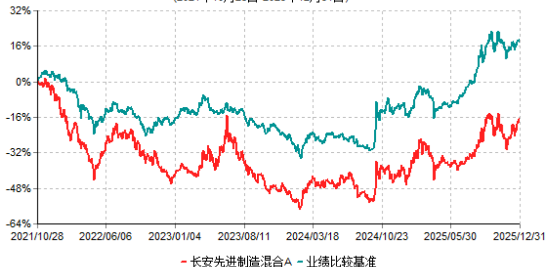
长安先进制造混合A累计净值增长率与业绩比较基准收益率历史走势对比图 (2021年10月28日-2025年12月31日)

根据基金合同的规定,自基金合同生效之日起 6 个月内基金各项资产配置比例需符合基金合同要求。本基金在建仓期结束后,各项资产配置比例已符合基金合同有关投资比例的约定。基金合同生效日至报告期期末,本基金运作时间超过一年。图示日期为 2021 年 10 月 28 日至 2025 年 12 月 31 日。