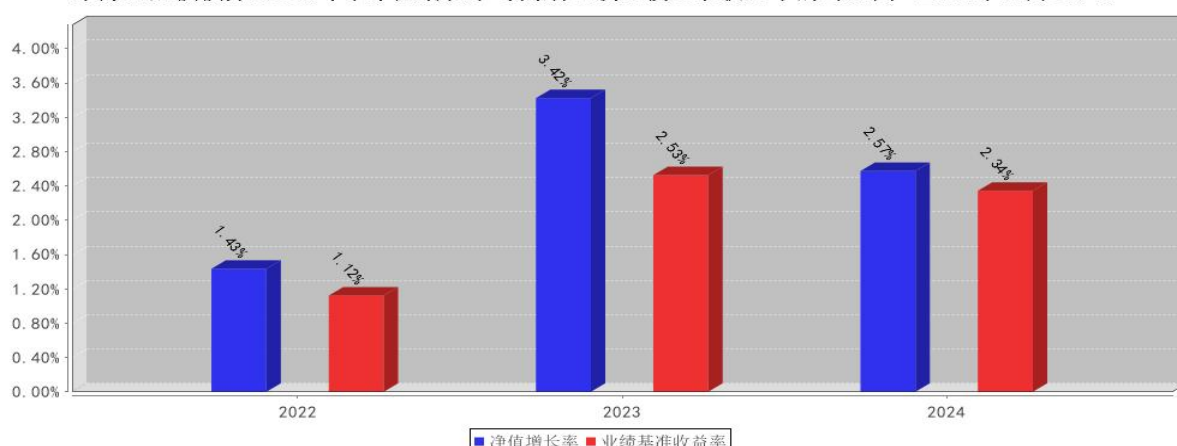
东方红短债债券E基金每年净值增长率与同期业绩比较基准收益率的对比图（2024年12月31日）