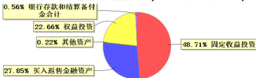
投资组合资产配置图表(2025年12月31日)

● 固定收益投资 ● 买入返售金融资产 ● 其他资产 ● 权益投资 ● 银行存款和结算备付金合计