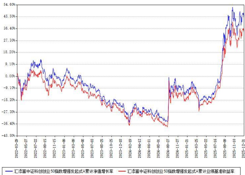
汇添富中证科创创业50指数增强发起式A累计净值增长率与同期业绩基准收益率对比图

(二)自基金合同生效以来基金累计净值增长率变动及其与同期业绩比较基准收益率变动的比较图