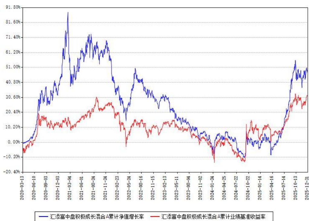
汇添富中盘积极成长混合A累计净值增长率与同期业绩基准收益率对比图

(二)自基金合同生效以来基金累计净值增长率变动及其与同期业绩比较基准收益率变动的比较图