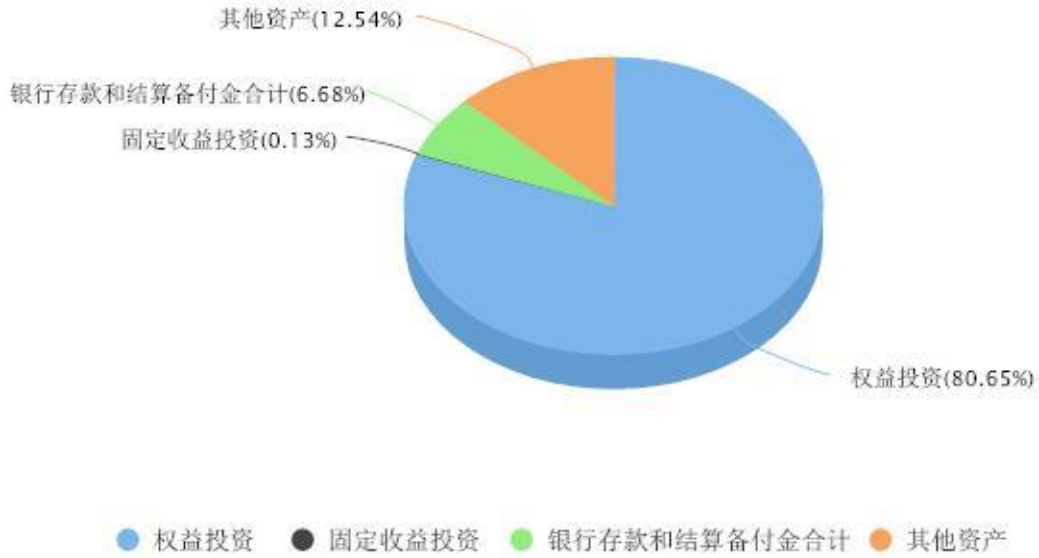
投资组合资产配置图表 数据截止日期:2025年12月31日