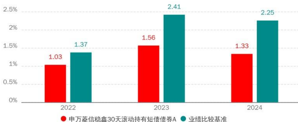
基金的过往业绩不代表未来表现，数据截止日：2024年12月31日