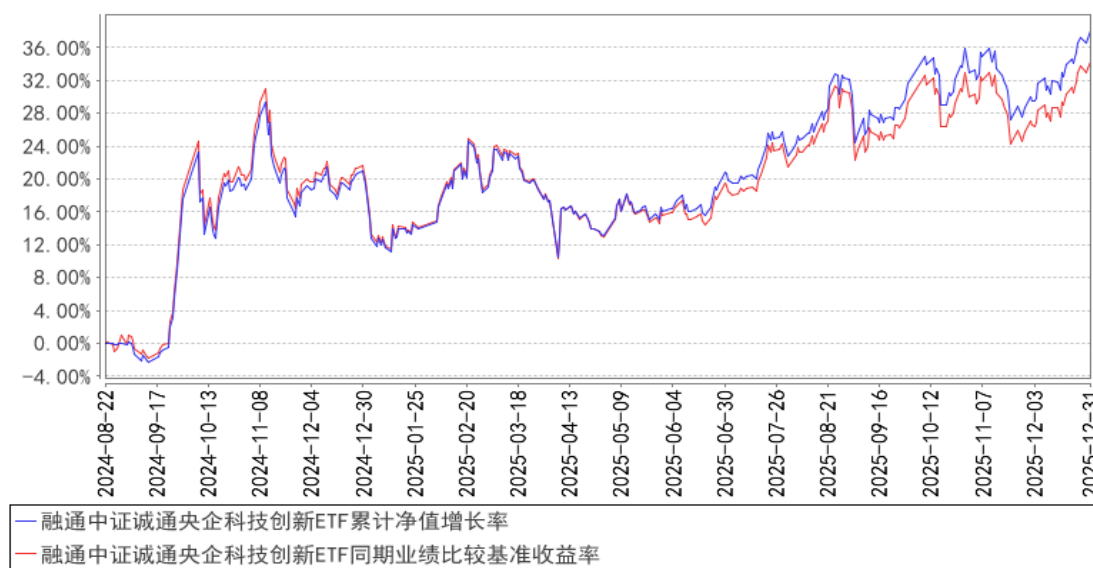
融通中证诚通央企科技创新ETF累计净值增长率与同期业绩比较基准收益率的历史走势对比图

注：本基金的建仓期为自合同生效日起 6 个月，至建仓期结束，各项资产配置比例符合合同约定。