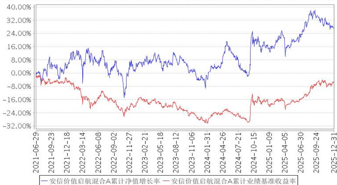
安信价值启航混合A累计净值增长率与同期业绩比较基准收益率的历史走势对比图