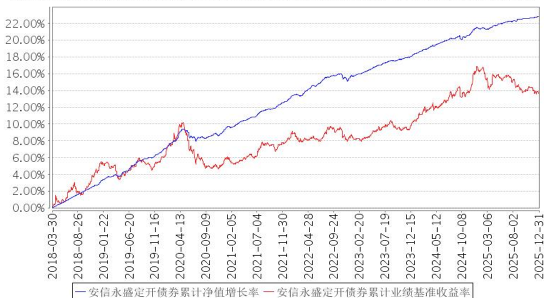
安信永盛定开债券累计净值增长率与同期业绩比较基准收益率的历史走势对比图