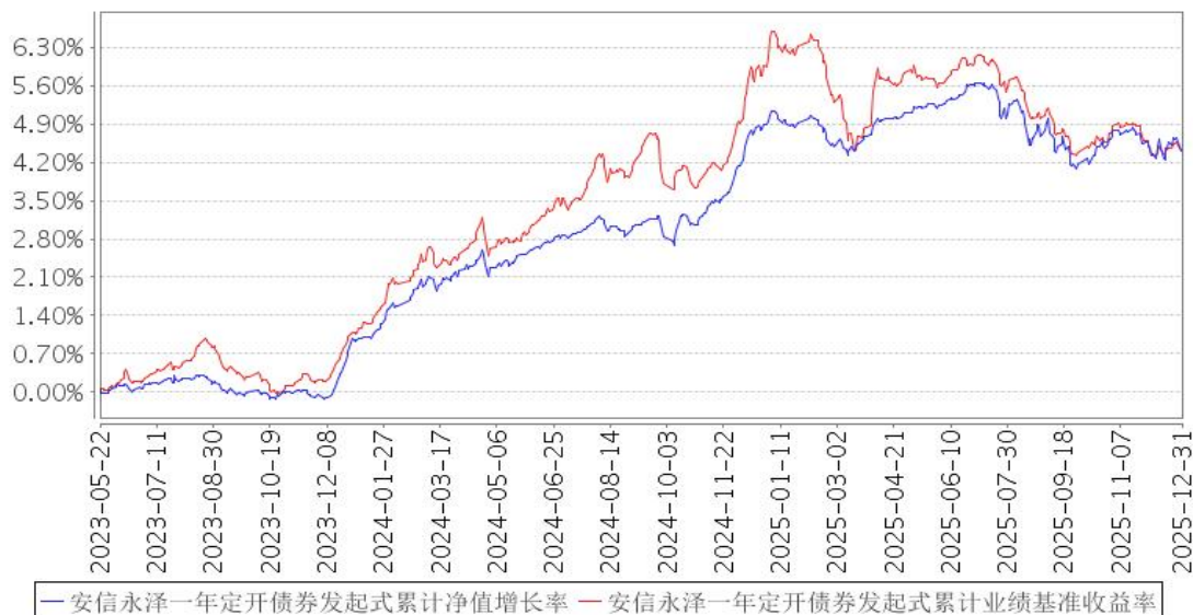
安信永泽一年定开债券发起式累计净值增长率与同期业绩比较基准收益率的历史走势对比图