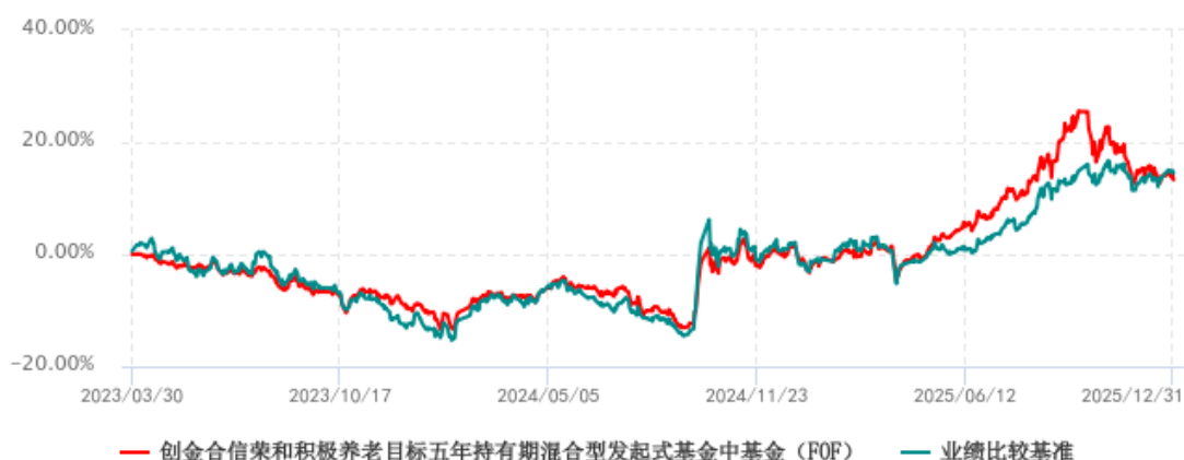
创金合信荣和积极养老目标五年持有期混合型发起式基金中基金（FOF）累计净值增长率与业绩比较基准收益率历史走势对比图 (2023年03月30日-2025年12月31日)