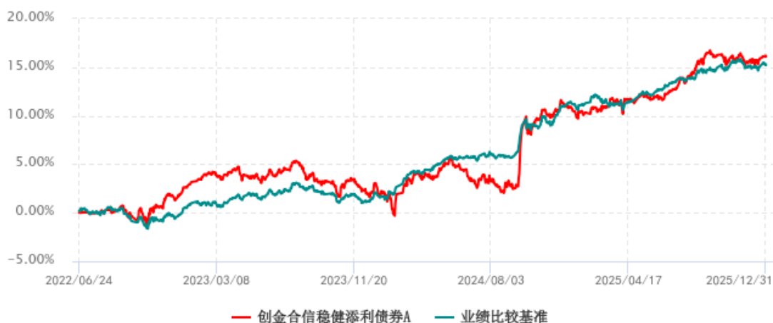
创金合信稳健添利债券A累计净值增长率与业绩比较基准收益率历史走势对比图 (2022年06月24日-2025年12月31日)