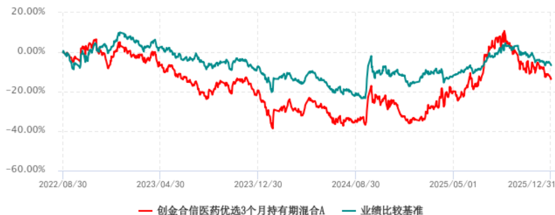
创金合信医药优选3个月持有期混合A累计净值增长率与业绩比较基准收益率历史走势对比图 (2022年08月30日-2025年12月31日)