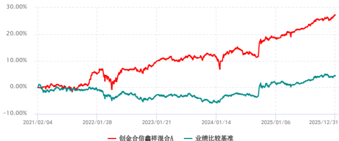
创金合信鑫祥混合A累计净值增长率与业绩比较基准收益率历史走势对比图 (2021年02月04日-2025年12月31日)