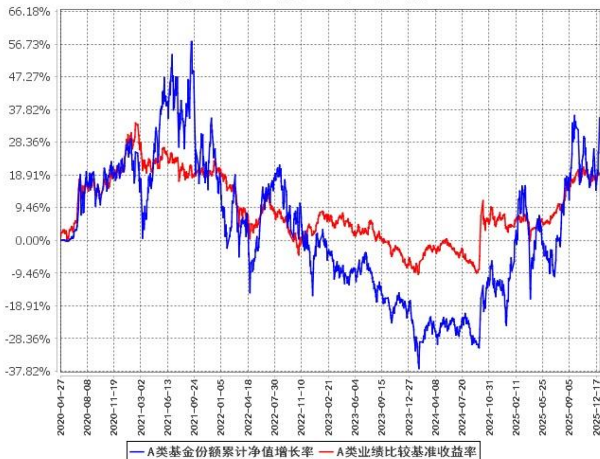
A类基金份额累计净值增长率与同期业绩比较基准收益率的历史走势对比图 (2020年4月27日至2025年12月31日)