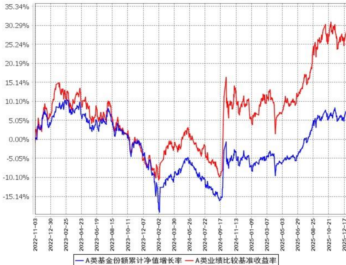
A类基金份额累计净值增长率与同期业绩比较基准收益率的历史走势对比图 (2022年11月3日至2025年12月31日)