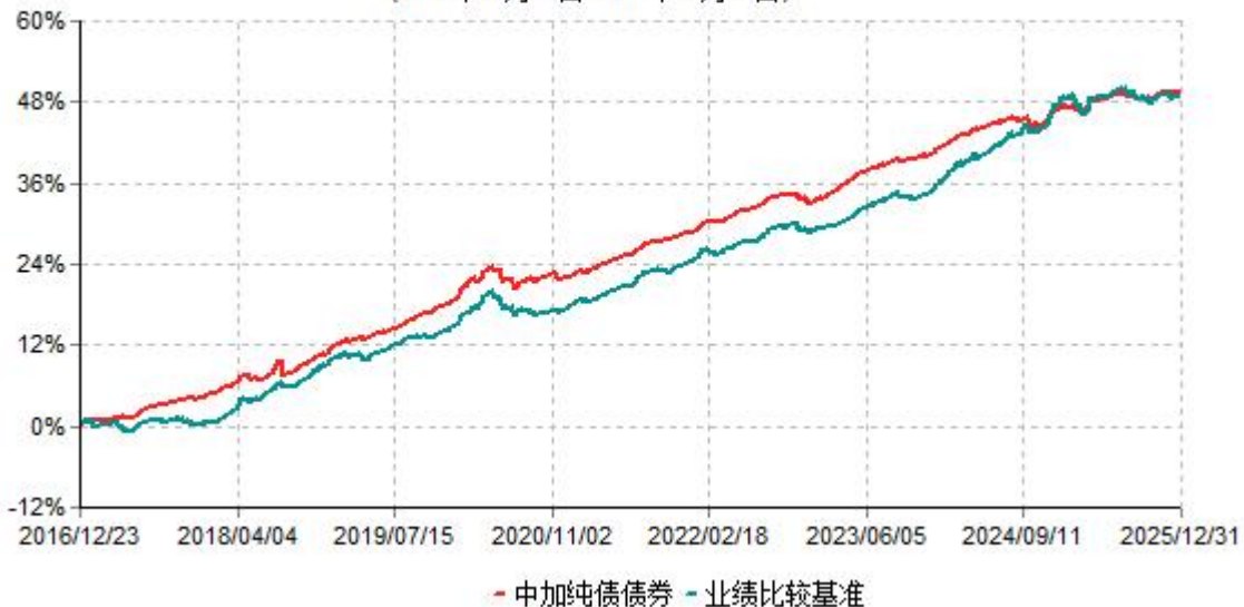
中加纯债债券累计净值增长率与业绩比较基准收益率历史走势对比图 (2016年12月23日-2025年12月31日)