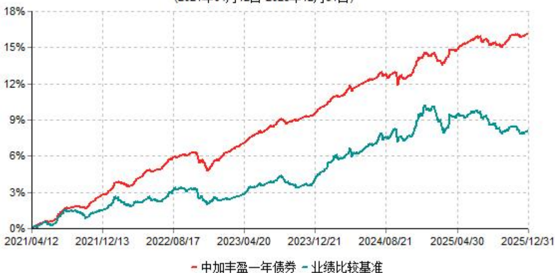
中加丰盈一年债券累计净值增长率与业绩比较基准收益率历史走势对比图 (2021年04月12日-2025年12月31日)