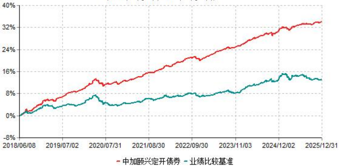
中加颐兴定开债券累计净值增长率与业绩比较基准收益率历史走势对比图 (2018年06月08日-2025年12月31日)