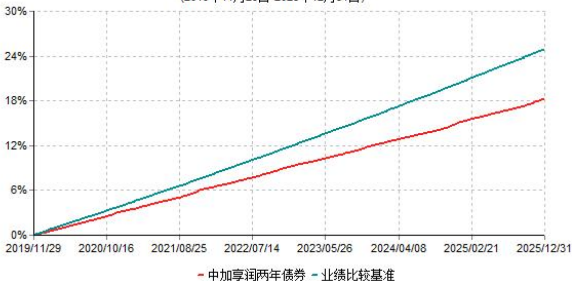
中加享润两年债券累计净值增长率与业绩比较基准收益率历史走势对比图 (2019年11月29日-2025年12月31日)