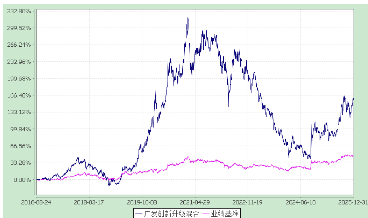
广发创新升级灵活配置混合型证券投资基金 份额累计净值增长率与业绩比较基准收益率的历史走势对比图 (2016年8月24日至2025年12月31日)