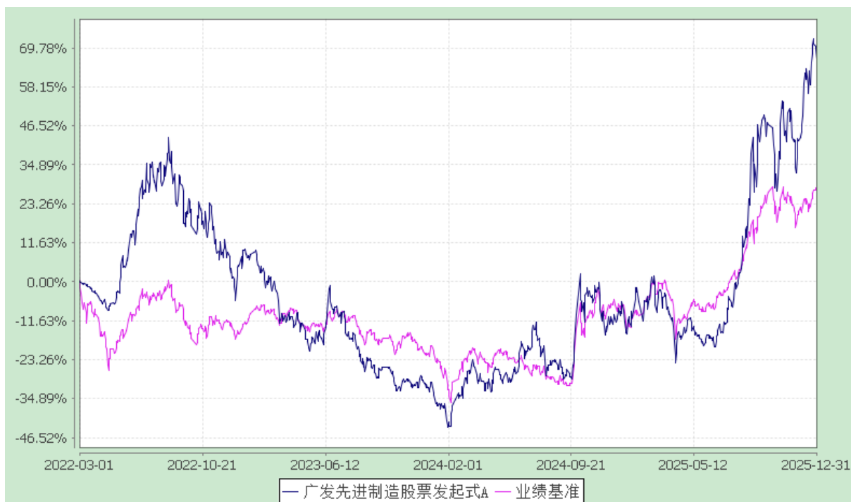
广发先进制造股票发起式 C