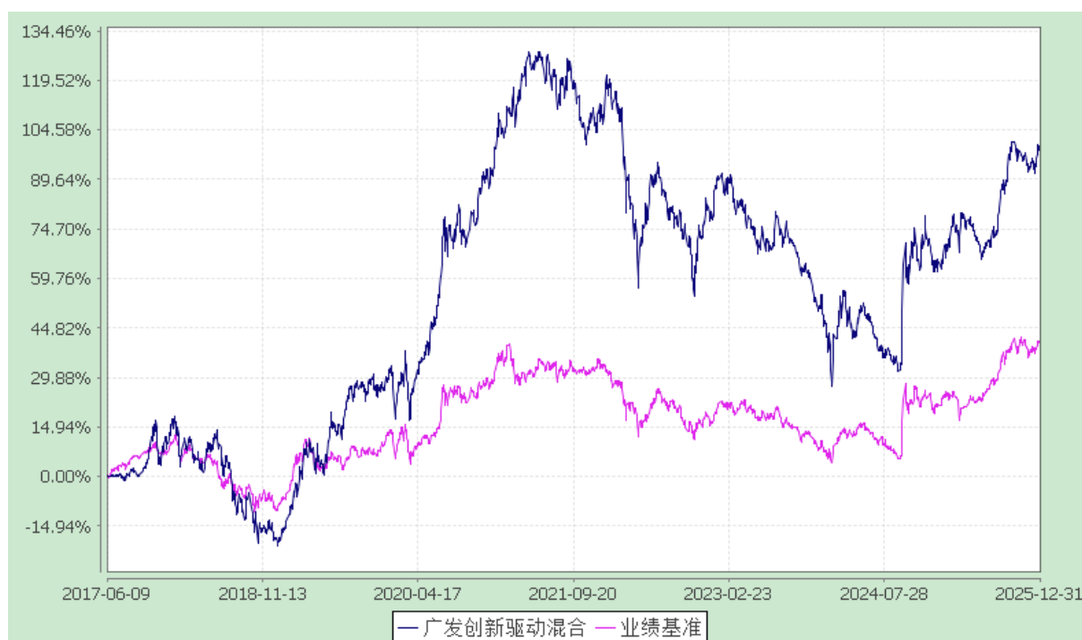
广发创新驱动灵活配置混合型证券投资基金 份额累计净值增长率与业绩比较基准收益率的历史走势对比图 (2017年6月9日至2025年12月31日)