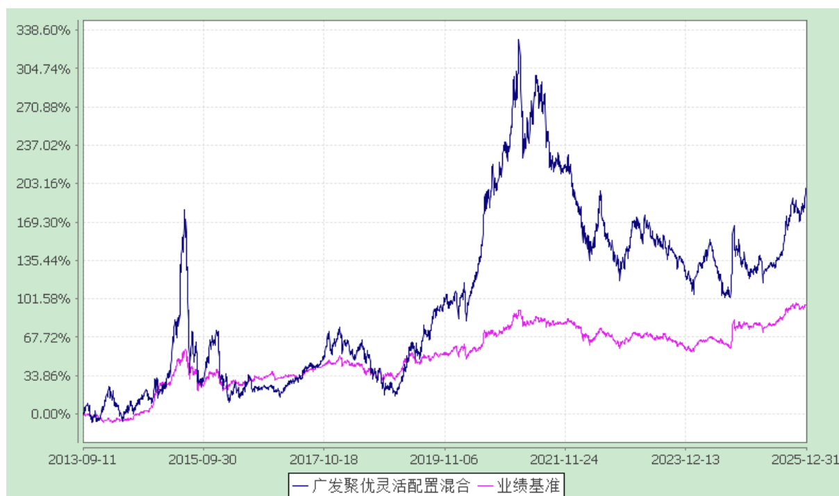
广发聚优灵活配置混合型证券投资基金 份额累计净值增长率与业绩比较基准收益率的历史走势对比图 (2013年9月11日至2025年12月31日)