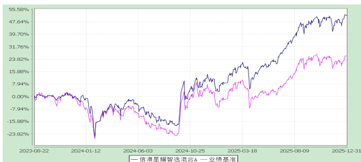
信澳星耀智选混合 A 累计净值增长率与业绩比较基准收益率的历史走势对比图 (2023 年 8 月 22 日至 2025 年 12 月 31 日)