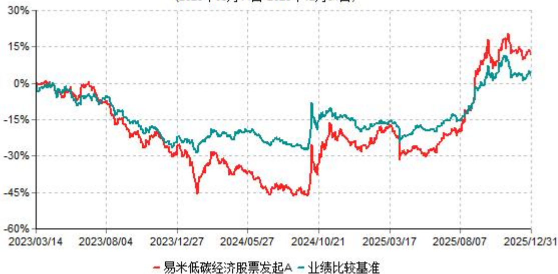
易米低碳经济股票发起A累计净值增长率与业绩比较基准收益率历史走势对比图 (2023年03月14日-2025年12月31日)