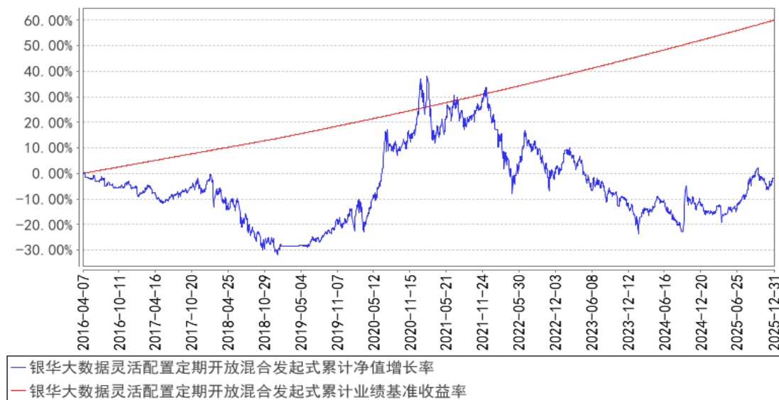
银华大数据灵活配置定期开放混合发起式累计净值增长率与同期业绩比较基准收益率的历史走势对比图

注：按基金合同的规定，本基金自基金合同生效起六个月内为建仓期，建仓期结束时本基金的各项投资比例已达到基金合同的规定：在开放期内股票投资比例为基金资产的 0%-95%，在封闭期内股票投资比例为基金资产的 0%-100%；权证投资比例为基金资产净值的 0%-3%；开放期内的每个交易日日终，在扣除股指期货合约需缴纳的交易保证金后，应当保持不低于基金资产净值 5%的现金或到期日在一年以内的政府债券。在封闭期内，本基金不受上述 5%的限制，但每个交易日日终在扣除股指期货合约需缴纳的交易保证金后，应当保持不低于交易保证金一倍的现金。其中，现金