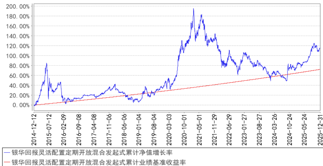
银华回报灵活配置定期开放混合发起式累计净值增长率与同期业绩比较基准收益率的历史走势对比图

注：按基金合同的规定，本基金自基金合同生效起六个月内为建仓期，建仓期结束时本基金的各项投资比例已达到基金合同的规定：股票投资比例为基金资产的 0%-95%；权证投资比例为基金资产净值的 0-3%；开放期内的每个交易日日终，在扣除股指期货合约需缴纳的交易保证金后，应当保持不低于基金资产净值 5%的现金或到期日在一年以内的政府债券。在封闭期内，本基金不受上述 5%的限制，但每个交易日日终在扣除股指期货合约需缴纳的交易保证金后，应当保持不低于交易保证金一倍的现金。其中，现金不包括结算备付金、存出保证金、应收申购款等。