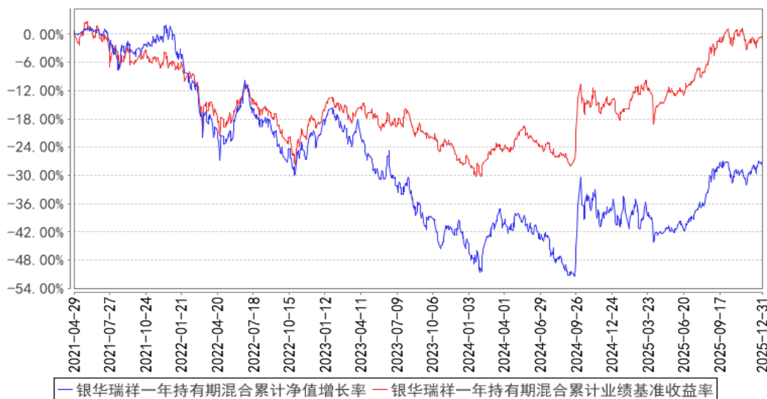
银华瑞祥一年持有期混合累计净值增长率与同期业绩比较基准收益率的历史走势对比图

注：按基金合同的规定，本基金自基金合同生效起六个月内为建仓期，建仓期结束时本基金的各项投资比例已达到基金合同的规定：本基金投资于股票资产占基金资产的比例为 60%-95%，其中