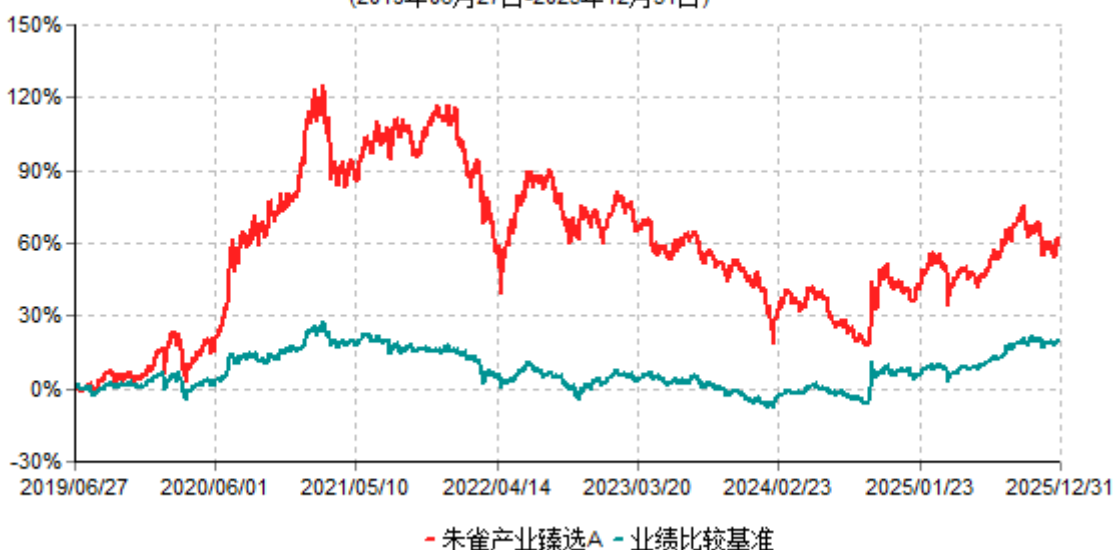
朱雀产业臻选A累计净值增长率与业绩比较基准收益率历史走势对比图 (2019年06月27日-2025年12月31日)