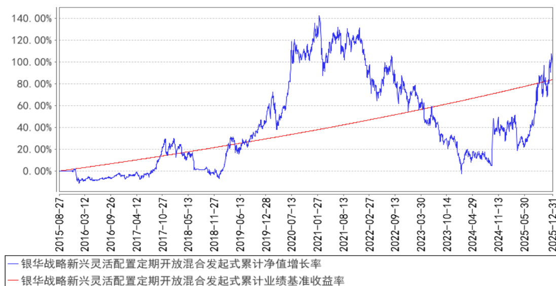
银华战略新兴灵活配置定期开放混合发起式累计净值增长率与同期业绩比较基准收益率的历史走势对比图

注：按基金合同的规定，本基金自基金合同生效起六个月内为建仓期，建仓期结束时本基金的各项投资比例已达到基金合同的规定：在开放期内股票投资比例为基金资产的 0%-95%，在封闭期内股票投资比例为基金资产的 0%-100%；权证投资比例为基金资产净值的 0%-3%。