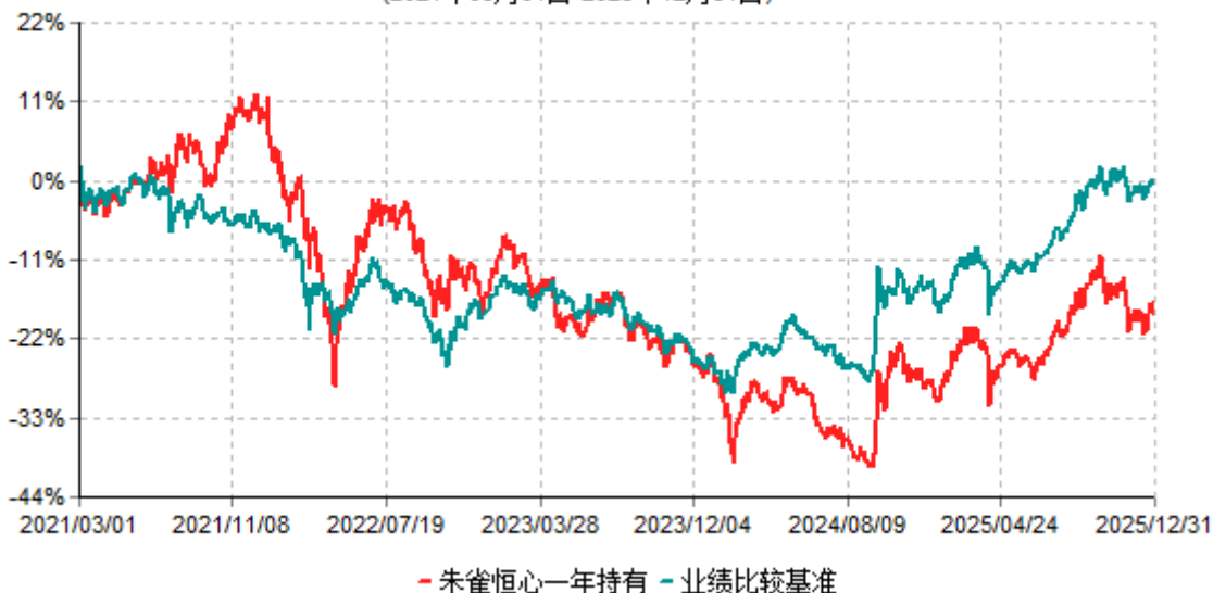
朱雀恒心一年持有累计净值增长率与业绩比较基准收益率历史走势对比图 (2021年03月01日-2025年12月31日)