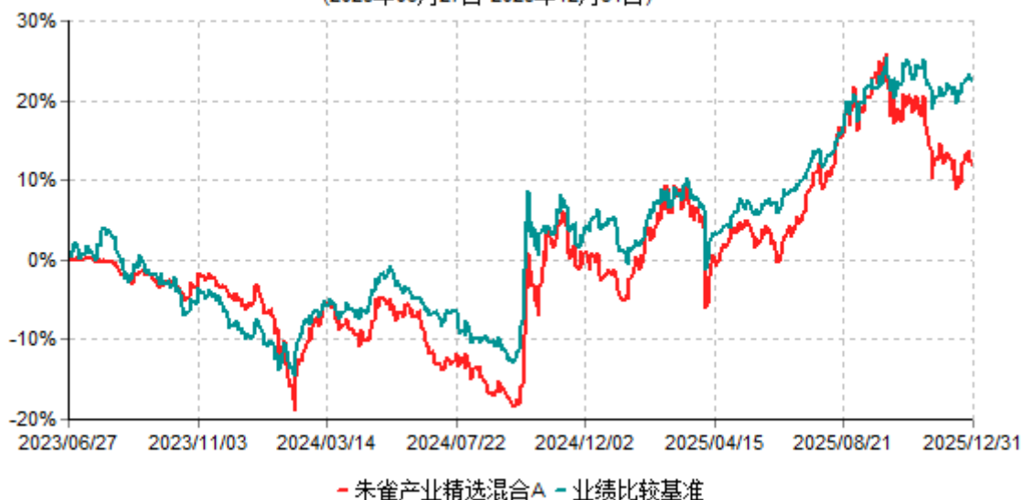
朱雀产业精选混合A累计净值增长率与业绩比较基准收益率历史走势对比图 (2023年06月27日-2025年12月31日)