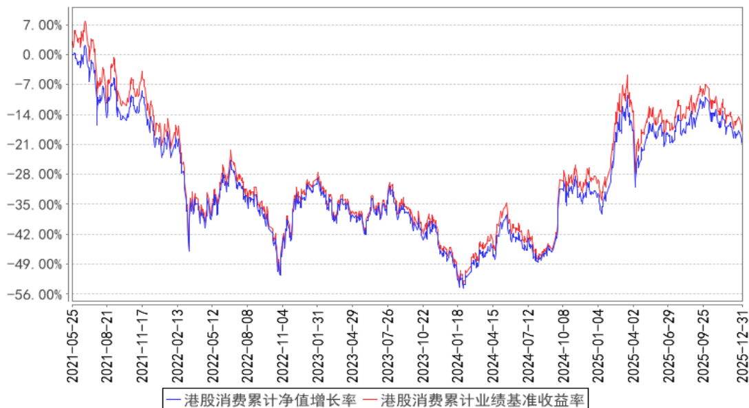
港股消费累计净值增长率与同期业绩比较基准收益率的历史走势对比图

注：按基金合同的规定，本基金自基金合同生效起六个月内为建仓期，建仓期结束时本基金的各项投资比例已达到基金合同的规定：标的指数成份股及备选成份股的资产比例不低于基金资产净值的90%，且不低于非现金基金资产的80%，每个交易日日终在扣除股指期货合约、股票期权合约需缴纳的交易保证金后，应当保持不低于交易保证金一倍的现金，其中，现金不包括结算备付金、存出保证金和应收申购款等，因法律法规的规定而受限制的情形除外。