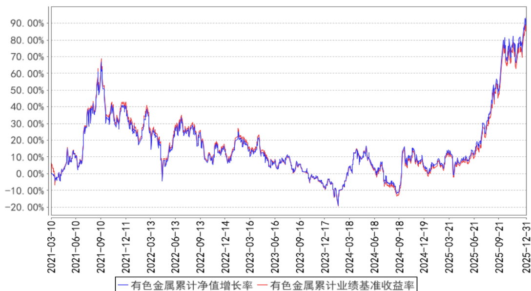
有色金属累计净值增长率与同期业绩比较基准收益率的历史走势对比图

注：按基金合同的规定，本基金自基金合同生效起六个月内为建仓期，建仓期结束时本基金的各项投资比例已达到基金合同的规定：本基金投资于标的指数成份股及备选成份股的资产比例不低于基金资产净值的 90%，且不低于非现金基金资产的 80%。