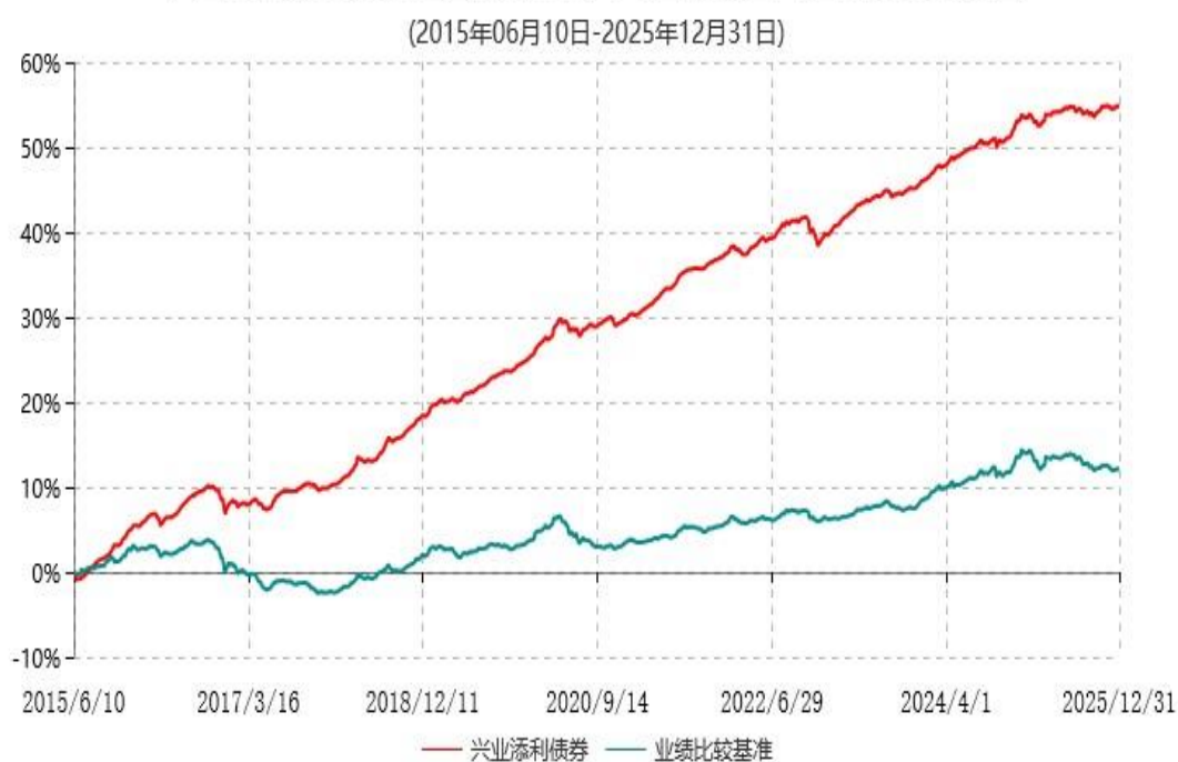
兴业添利债券型证券投资基金累计净值增长率与业绩比较基准收益率历史走势对比图